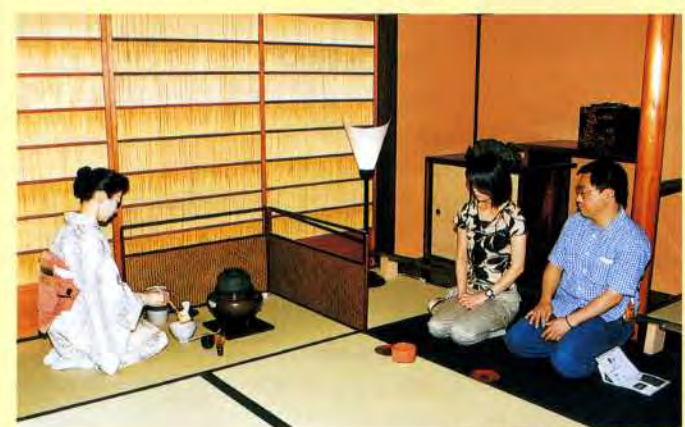
大阪市茶道部によるお点前の披露

お客さまに気軽に参加してもらい、お茶を楽しんでいただく会。大阪市茶道部に協力いただき