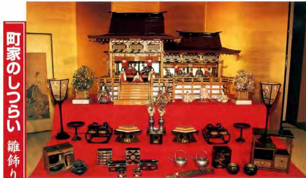
町家のくらし 雛飾り

江戸時代の京坂の雛飾りとはどんなものだったのでしょうか。江戸時代の風俗を考証した「守貞謄稿」(1853)によると、江戸では「壇を七、八段にして」いるのに対し、京坂では「二段ほどの壇に…屋根のない御殿の形を据えて殿中には夫婦一対の小雛を置き…また近年は豆御殿と名づけて一尺ほどの屋根のあるものを作って飾る」とあります。