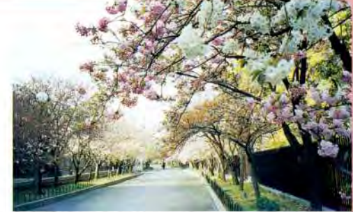
560mの小径にピンクや白さまざまに咲き競う造幣局の桜の通り抜け。八重桜は120品種、計370本。年々品種は増えている

桜は、人々の豊かな精神性を育んできたものの一つと言えるかもしれません。この春も市内のあらゆる場所で、个性的なお花見が楽しめることでしょう。