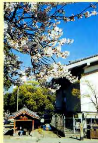
四天王寺境内で出会う桜

お花見シーズンのクライマックスを飾るのは、造幣局の桜の通り抜けでしょう。職員だけでなく、たくさんの人々に楽しんでもらおうと、明治16年から始まり、戦争で一時中断したものの、百年以上の歴史を誇っています。