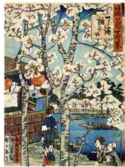
昔から桜の名所として桜宮が大川の対岸に描かれている。図は、「桜花白洲」天満橋の口(芳書画)大阪城天守閣蔵

春の桜之宮公園は、大川ぞいを埋めつくす桜の花で風景全体が淡いピンク色に染まります。その数、約1万本。花の下