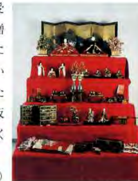
内裏雛(伊東家寄贈)