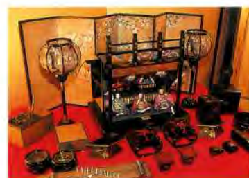
御殿雛(松崎家寄贈)

つまり、京坂では、壇の数はあまり多くなく、雛壇に御殿を組み立てて飾る「御殿飾り」が多かったようです。