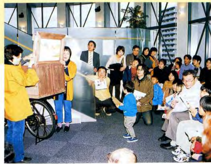
紙しばいの実演風景

テーマに選んだ「大阪のカエル・京のカエル」については、市販の絵本などが全くなかったため、資料を集めて研究しました。絵