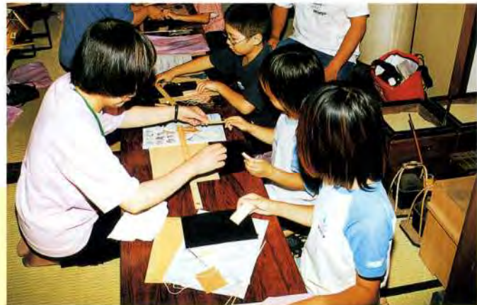
紙つばめワークショップ

(有料) 開催日:第2日曜 時間:午後1時30分~3時30分 場所:9階 築屋座敷