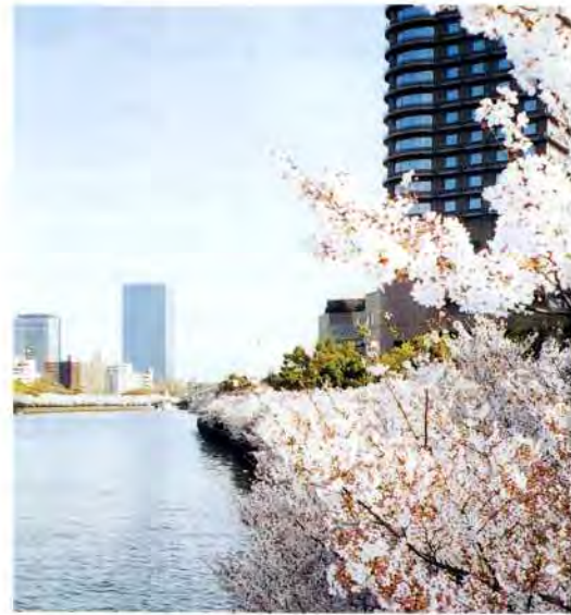
大阪の春を彩る大川ぞいの桜並木

春といえば桜。市内には大川ぞいの桜並木や大阪城公園など桜の名所、造幣局の桜の通り抜け、という名物行事もあります。大阪は市内各所に桜が植えられ、昔から、人々は宴に興じたり歌を詠んだり、さまざまに楽しんできました。日常の中でさりげなく桜を愛し、一方で積極的に桜と遊ぶ、そんなまち暮らしならではのお花見は、今も人々とともにあるようです。