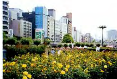
約4000株のバラが咲き誇るバラ園がひととき美しい中之島公園は、川とビルにはさまれた水の都の緑あふれる庭園

また、できるだけ自然に近い形で整備した公園もあります。たとえば、矢倉緑地。ここはもともと市内で唯一残された自然海岸を緑地として整備したところ。100種以上の野鳥が飛来する鳥の楽園で、荒磯や潮だまりでは海辺の生き物も生息しています。一方、公園内に