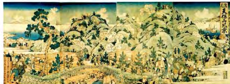
江戸時代の大坂の人々は近郊の花の名所で遊山を楽しみました。図は「浪花天保山風景」(歌川貞升・画 住まいのミュージアム蔵)