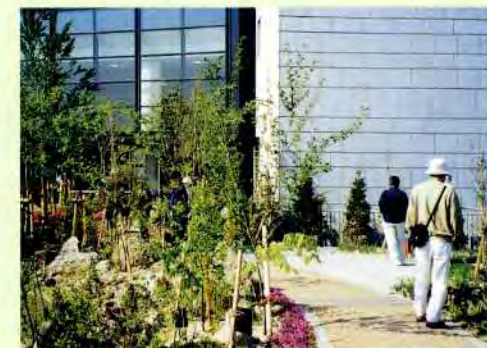
2階のルーフトガーデンは人工地盤における緑化技術の見本庭園

ます。地域自然誌の情報拠点といえるでしょう。こうした2つのエリアでの楽しい学びを通して、自然豊かなまちをみんなの手で、というのが願いです。みなさんも大いに利用してください。(入場無料。但しネイチャーホールでの特別展は有料)