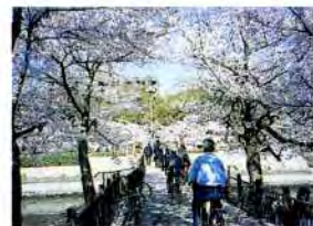
春、花見客でにぎわう桜之宮公園の大川沿いの桜並木