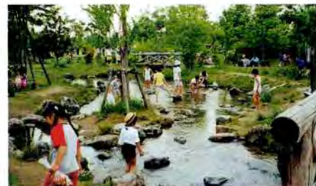
子どもたちが水遊びする花博公園鶴見緑地の「緑のせせらぎ」