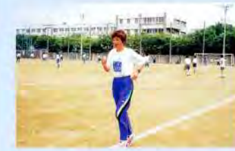
「長居馬(ま)一軍団」という自由参加のクラブを作り、長居公園で走る仲間も増えてきたと語る東さん。「走ることは自分の闘いですが、やはり、仲間がいてこそ頑張れる」と。