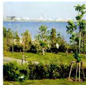
多くの野鳥と海辺の生き物たちを観察できる矢倉緑地