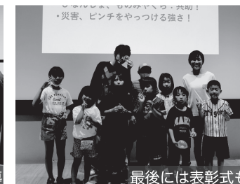
最後には表彰式も

毎年恒例となりました、夏休みの小学生向けワークショップです。 ダンボールを使ってホールいっぱいに大きな“まち”をつくります。 ものづくりの楽しさを一緒に体験しましょう！