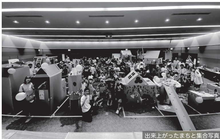
出来上がったまちと集合写真