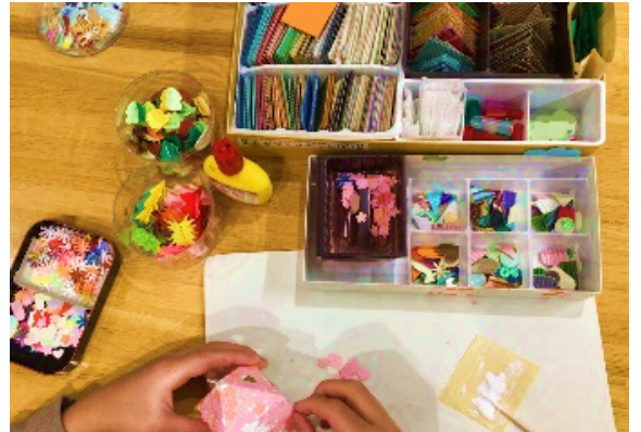
ボンドで材料を貼っていきます。

住まいのライブラリーには絵本のほか、住まい、大阪、建築に関する本もあります。閲覧・貸出しができるよ！