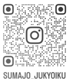
SUMAJO_JUKYOKU おうちづくり体験

※材料の準備などがありますので、ご都合で参加できない場合は、早めにご連絡ください。 ※午前8時45分時点で「暴風警報」が発令されている場合は中止とさせていただきます。その他、やむを得ない状況によりイベントを中止する場合がございます。その場合は、住まい情報センターのウェブサイト等でお知らせします。 ※手話通訳をご希望の方は、イベント開催の2週間前までにお問い合わせください。 ※お申し込み時にご記入いただいた個人情報は、主催者が適切に管理し、当イベントに関する連絡、統計データにのみ使用します。