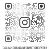
OSAKAHOUSINGINFORMATIONCENTER 新着本やイベント案内

〒530-8582（住所不要）大阪市立住まい情報センター 4階住情報プラザ 「おはなし会 & おうちをつくろう！ 9/1」係 FAX：06-6354-8601 ← ウェブサイト「おおさか・あんじゅ・ネット（イベント情報）」 https://www.osaka-angenet.jp