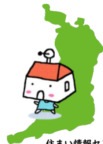
住まい情報センター キャラクター すまじょくん